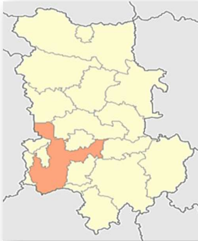
Фиг.1- Разположение на община Родопи в територията на област Пловдив

Община Родопи се намира в Южна България югозападно от град Пловдив и административно принадлежи към едноименната област – пловдивска област. Разположена е в онази част на Горнотракийската низина, която граничи на север с община Съединение и е в близост до подножието на Средна гора, а на юг с подножието на северните склонове планина Родопи.