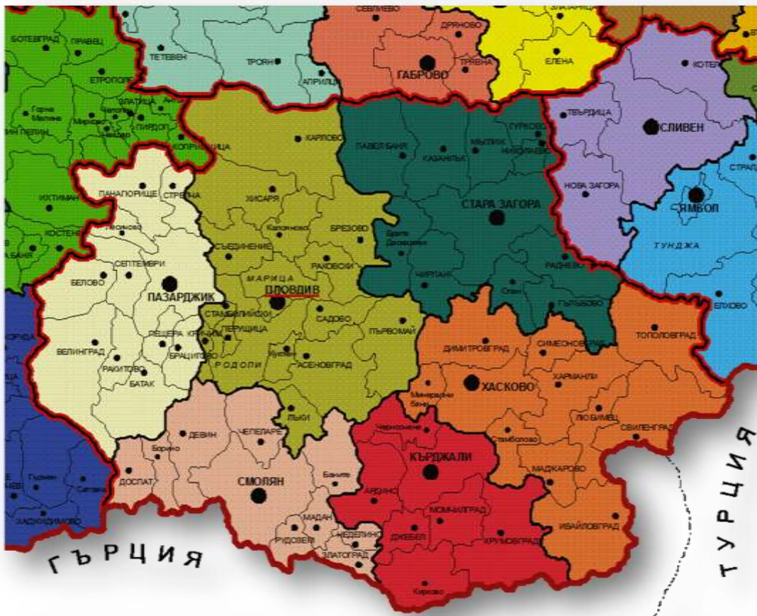
Фиг.3- Разположение на областите и общините в Южен централен район за планиране

Община „Родопи“ има територия от 524 кв.км и заема около 10% от площта на Пловдивска област и 1.9% от територията на ЮЦР. От следващата фиг.3 ясно се виждат както разположението на община Родопи в Южния централен район за планиране, така и разположението на областите и общините в него.